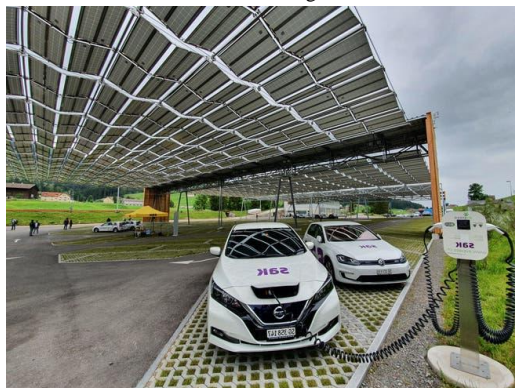
Das solare Parkplatz-Faltdach der St. Gallisch-Appenzellischen Kraftwerke (SAK) in Jakobsbad AI. (22. Juni 2020)

Die Schweiz verpasst den Solarausbau. Ein Grund könnte der Fokus der Politik auf die Wasserkraft sein. Jürg Meier 15.05.2021, 21.45 Uhr